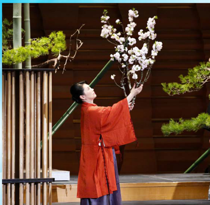
いけばな：池坊専好