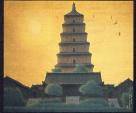
平山郁夫筆「明けゆく長安大雁塔・中国」(「大唐西域壁画」より第1場面)

壮大なシルクロードの世界を生涯のテーマとしていた故平山郁夫先生(1930年6月15日～2009年12月2日 前東京藝術大学学長)が、20年の歳月をかけて完成させた「大唐西域壁画」を中心に回顧する特別展が、2011年1月18日～3月6日まで東京国立博物館にて開催されます。これと相まって、この度、一周忌を迎えた平山郁夫先生の追悼として、オペラ《遣唐使～阿倍仲麻呂～》全4幕を東京藝術大学奏楽堂にて上演いたします。「平城遷都1300年祭」を機として創作されたこのオペラは、奈良・薬師寺玄奘三蔵院の「大唐西域壁画」の前で2009年6月に前編、2010年6月に後編が初演され、今回が全曲版による東京初演となります。